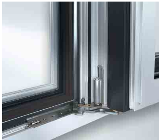
Ecklager mit 180°-Öffnungswinkel Corner pivot with 180° opening angle