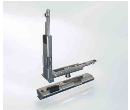
Eckumlenkung mit integrierter Schließrolle und Auflaufbock Corner drive with integrated locking roller and engagement block