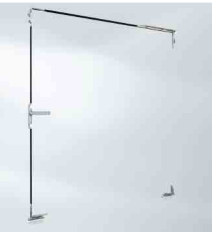
Beschlagskonfiguration Dreh-Kipp-Fenster Fittings configuration for turn/tilt windows