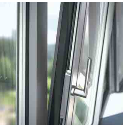
Hybrid-Riegelstange in bewährtem Alu-Design Hybrid locking bar in tried-and-tested aluminium design